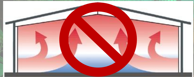
Warmluft- / Konvektionsheizungen

Warmluft-/Konvektionsheizungen arbeiten nach dem Konvektionsprinzip. Das komplette Hallenvolumen vom Boden bis zur Decke muss extrem stark aufgeheizt werden, damit im unteren Bereich noch ausreichend Wärme ankommt. Durch die Luftbewegungen werden zudem Viren, Bakterien, Aerosole, Stäube und Pollen im Raum verteilt.